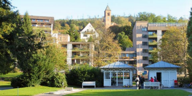
Die Celenus Klinik Bad Herrenalb